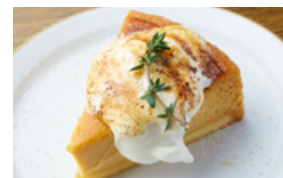
キャラメルプリンチーズケーキプリュレ 723yen(795yen)