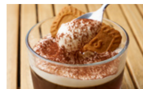
ティラミス風コーヒーゼリー 596yen(655yen)