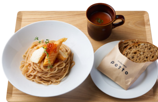
全粒粉生パスタ+スープ+石窯シリアルブレッド Ver.