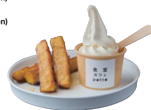
タニタカフェ® 豆乳ソフトクリーム さつまいものフライドポテトと はちみつときな粉 814yen(895yen)