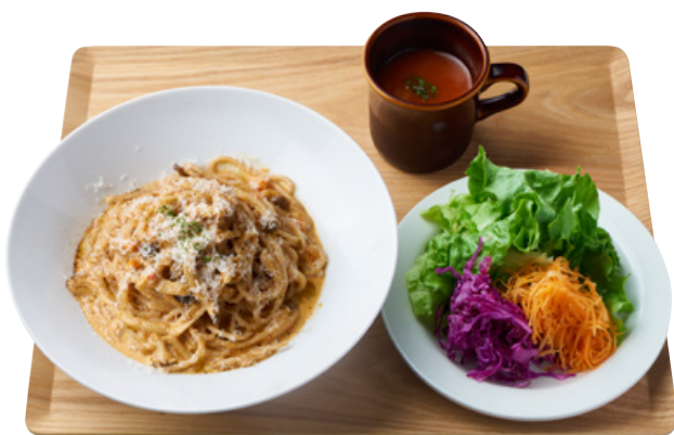
全粒粉生パスタ+スープ+サラダ Ver.